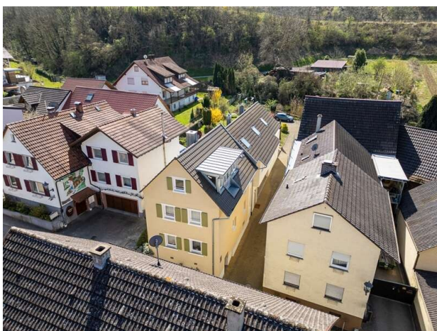
ANSICHT VON OBEN!