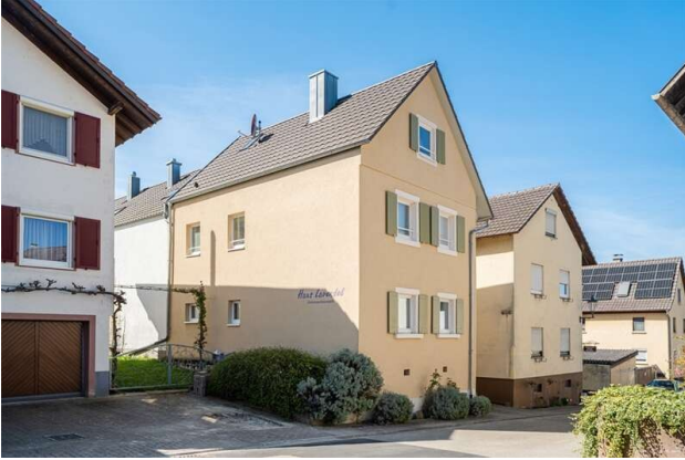
ANSICHT VON DER STRAßE!