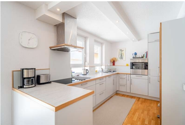
WOHNUNG 1: KÜCHE!