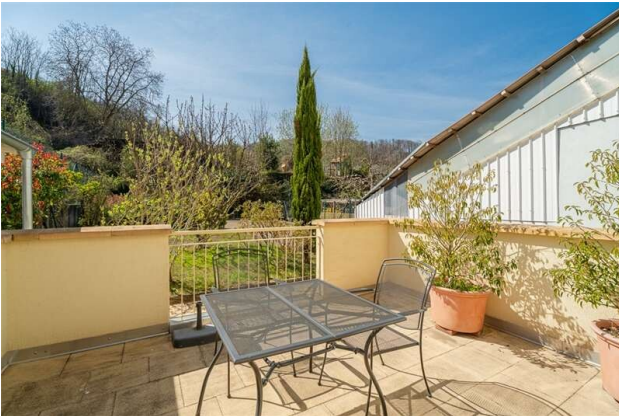
WOHNUNG 3: TERRASSE!