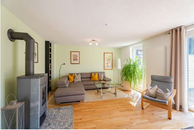
WOHNUNG 1: WOHNEN!