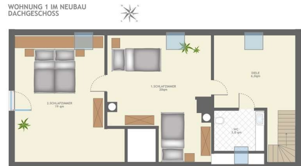
GRUNDRISS WOHNUNG 1 DG!