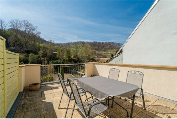
WOHNUNG 1: DACHTERRASSE!