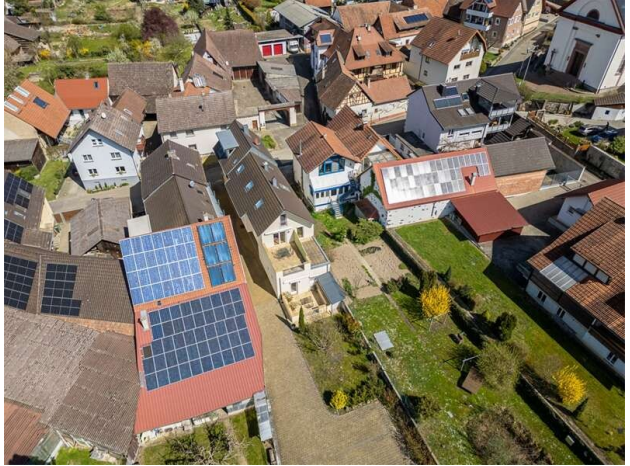
ANSICHT VON OBEN!