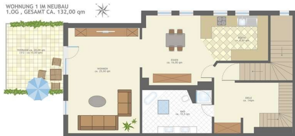
GRUNDRISS WOHNUNG 1 OG!