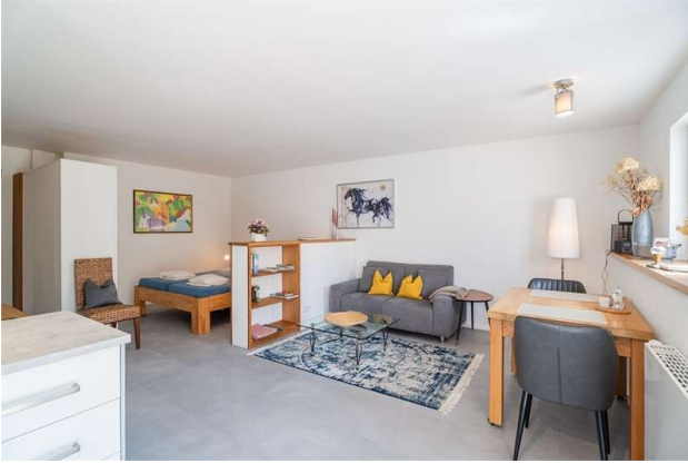
WOHNUNG 3: WOHNEN, SCHLAFEN!