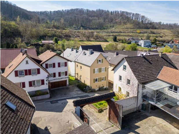
BERGE UND WALD!