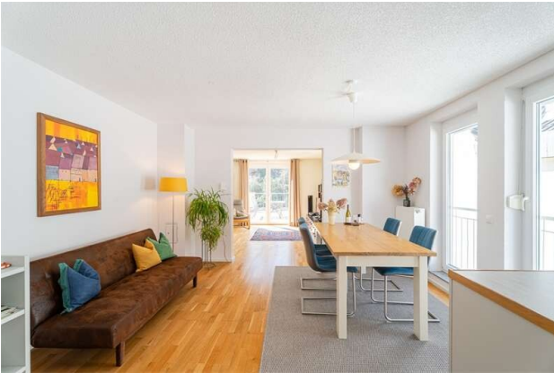
WOHNUNG 1: ESSEN!