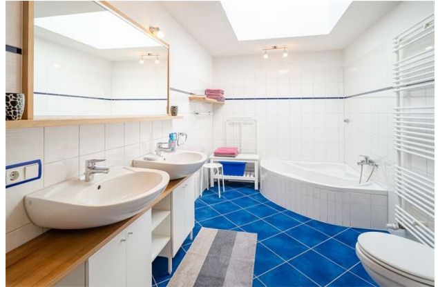
WOHNUNG 1: BADEZIMMER!