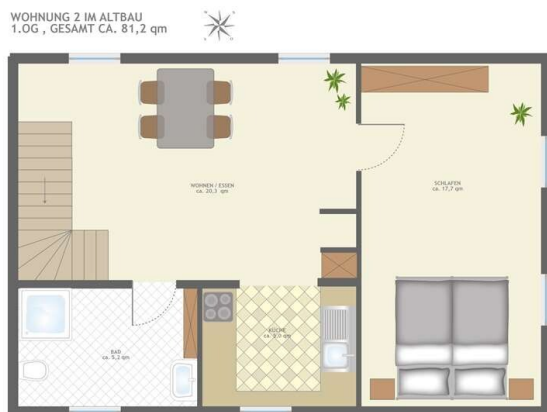
GRUNDRISS WOHNUNG 2 OG!