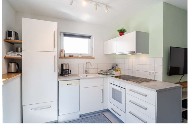
WOHNUNG 3: KÜCHE!